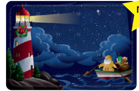
Motiv 04, "Leuchtturm"