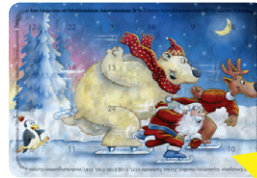
Motiv 03, "Schlittschuhlauf"