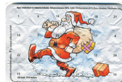
Motiv 07, "eiliger Weihnachtsmann"