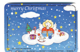
Motiv 08, "merry christmas Engel"