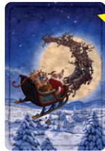
Motiv 02, "Mondfahrt"