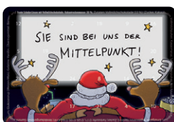
Motiv 13, "...der Mittelpunkt"