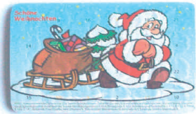
Motiv 05, "Weihnachtsmann"