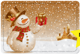
Motiv 01, "Schneemann"

Eigenes Motiv ab 3.000 Stück möglich. Bitte fordern Sie dazu unsere gesonderte Preisliste an!