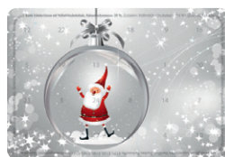
Motiv 14, "Weihnachtsmannkugel"