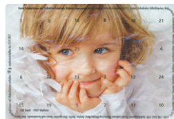
Motiv 10, "Engelskind"