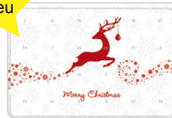
Motiv 11, "merry christmas Rentier"