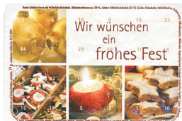
Motiv 06, "...frohes Fest"